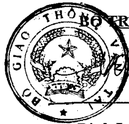
Đinh La Thăng